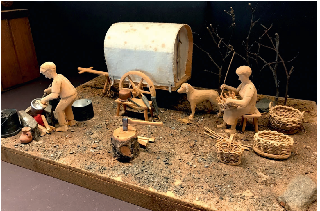
Auch die fahrenden Kesselflicker, Schirmflicker und Korbflechter hatten ihre Aufgabe im ländlichen Alltag.