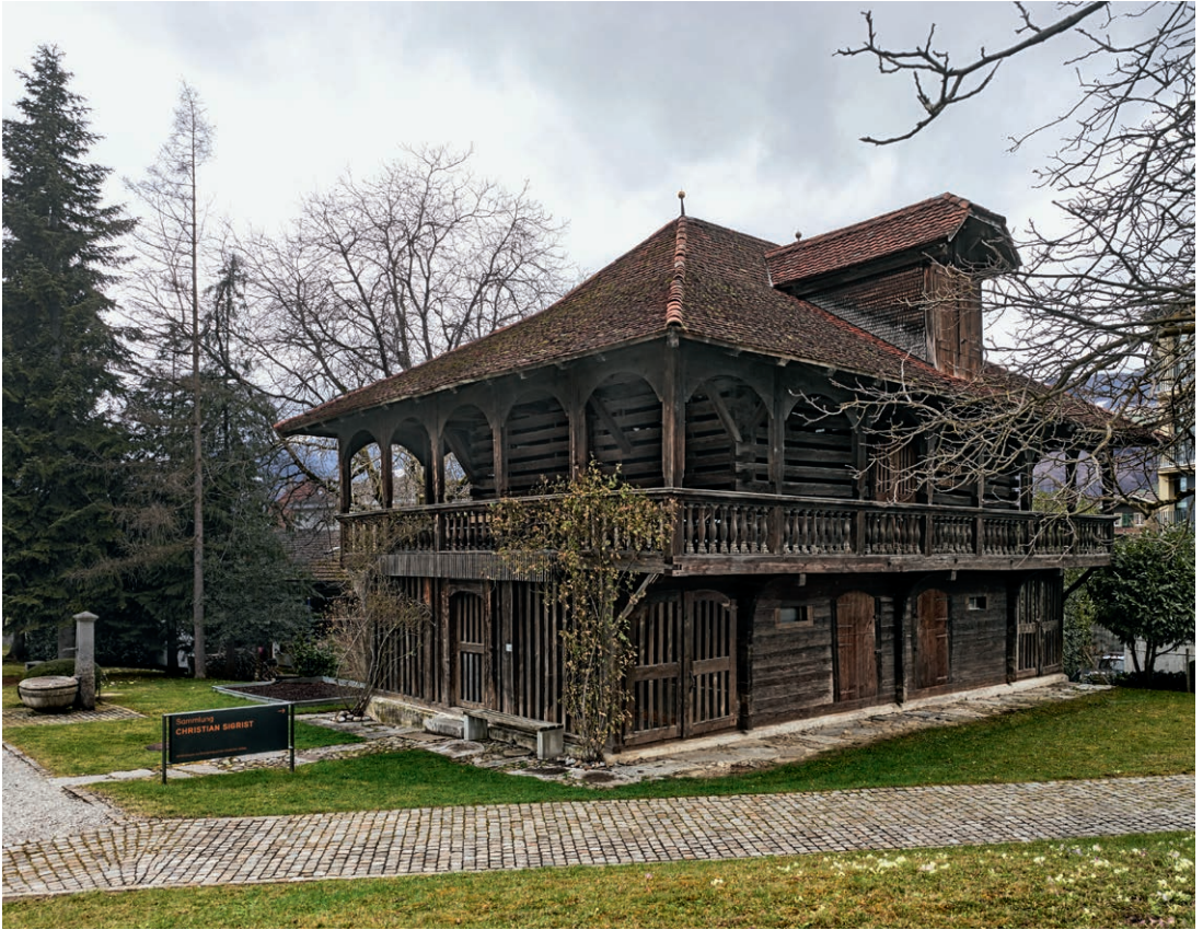
Die «Sammlung Christian Sigrist» im Ökonomiegebäude des Museums Bruder Klaus in Sachseln.

Am 5. Mai 1984 erfolgte die Gründungsversammlung des Vereins «Sammlung Christian Sigrist». Der Vereinszweck dient dem Erhalt und der dauernden Präsentation der Miniaturdarstellungen von Christian Sigrist. Bereits ein Jahr danach, am 11. Mai 1985 konnte die Ausstellung der 28 Exponate im Ökonomiegebäude des Museums Bruder Klaus mit einem legendären Volksfest eröffnet werden. Heute, nach 40 Jahren ist das Museum fest im kulturellen Angebot von Obwalden verankert und erfreut sich einer steigenden Beliebtheit.