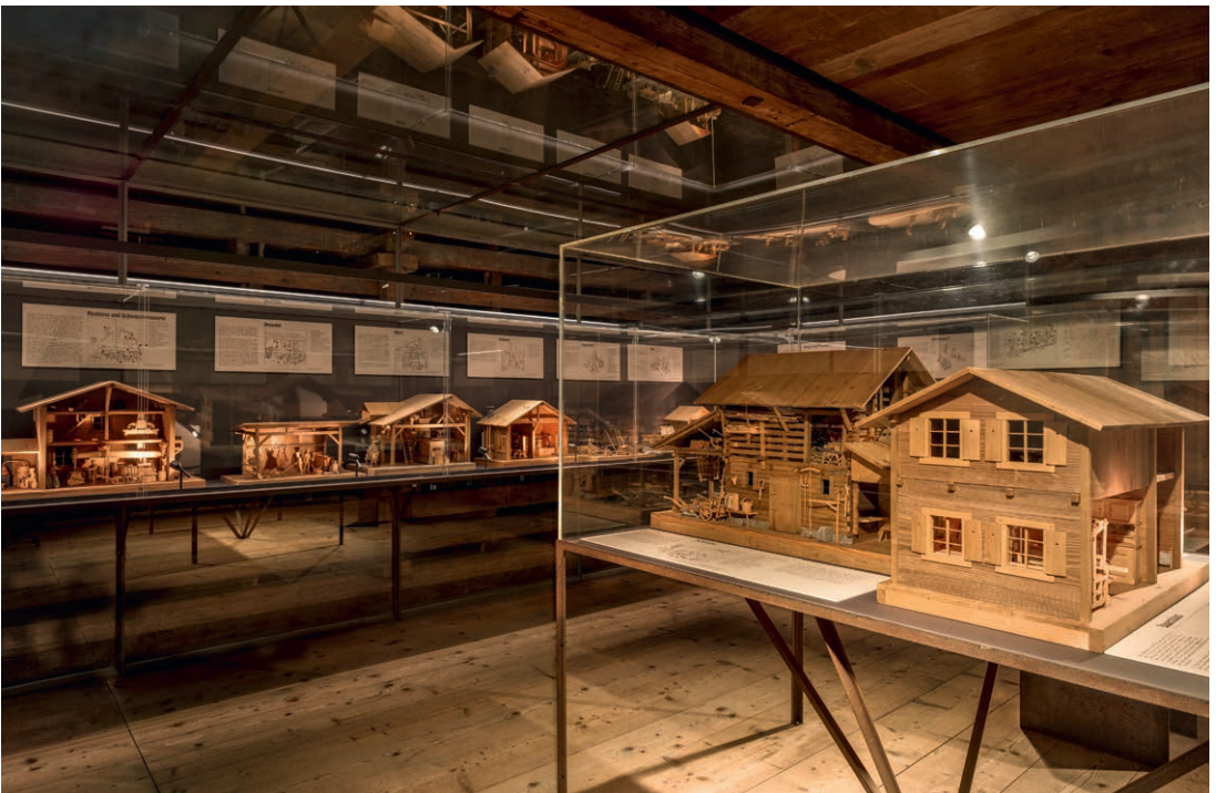
Rund um das Bauernhaus mit der Scheune im Zentrum repräsentieren all die Miniaturmodelle auf eindruckliche Weise den ländlichen Alltag.