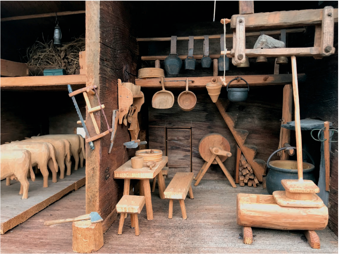
Die Alphütte, das erste Werk der Sammlung, entstand 1973 für die Hobbyausstellung anlässlich der Einweihung des Schulhauses Mattli in Sachseln.