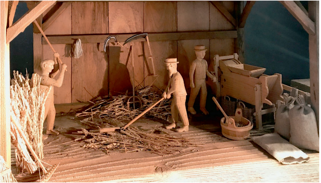
Nach dem Dreschen des Kornes erfolgte der Gang zur Mühle und weiter zum Bäcker, der das Mehl zum Brot verarbeitete. Heute erntet und drischt ein einziger Mann ganze Felder mit dem Mährescher.