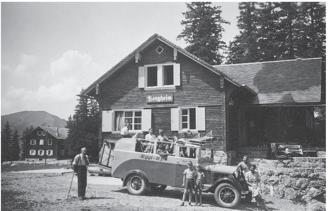
Die «Äggi-Post», ein von Christian Sigrist zum Universaltransporter umgebauter Ford Lastwagen. Von der Versorgung des Bergrestaurants über die Fahrhabe der Äpler bis zu den Touristen und dem Vieh konnte alles transportiert werden.