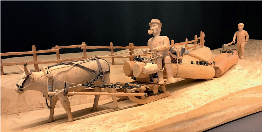
In der winterlichen Holzfuhr, dem «Holzsilä», wird mit dem Zwick das Bau- und Brennholz zum Tal befördert.

verschwinden sah: eine Schmiede, eine Küferei, eine Sägerei. Die meisten dieser Modelle entstanden in der Stille und Abgeschlossenheit seines Hauses in Arben.