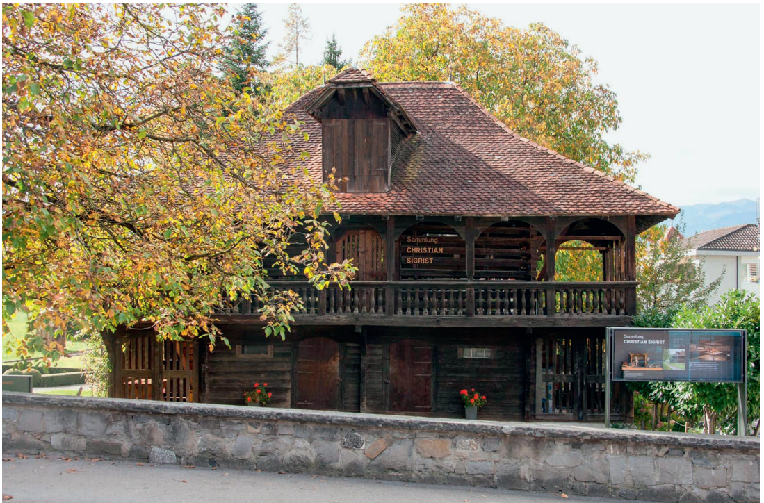
In den Jahren 2015 / 16 erfolgte eine sanfte Renovation der Ausstellung und eine subtile Neubeschriftung des historischen Gebäudes sowie die Errichtung eines Schaukastens an der Strasse, der zum Besuch der Ausstellung anregt.

Regelmässig kam er mit Grosstante Gritli zu uns auf den Geissfuss zu Besuch. Das war ein fast ritueller Ablauf: Zuerst wurde gegessen am grossen Tisch. Dädä sagte nie viel. Er war ein schweigsamer Mensch. Nach dem Essen wurde gejasst, aber ohne Dädä. Der verschwand dann gewöhnlich in der Holzhütte, und wir Kinder gingen ihm nach. Weil wir wussten, dass er dort für uns aus einem Stück Holz etwas schnitzen würde, ein Edelweiss etwa. Einmal wollte mein Bruder ein «Männli», einen Pfarrer. Er war sehr enttäuscht, als Dädä ihm keines machte. Als er wieder einmal auf Besuch