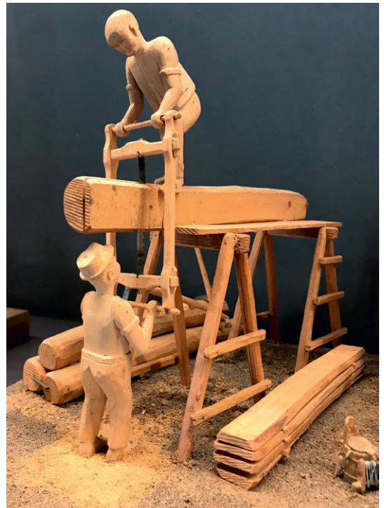
In stundenlanger Arbeit wird mit der zweihändigen Gattersäge ein Brett zugeschnitten.

Wir waren gerne bei Dädä, staunten, wie er mit seinen knorpeligen Händen aus einem Stück Holz so feine Sachen schnitzen konnte, waren fasziniert von seiner grossen Brille. Er gab uns nicht das Gefühl, dass wir ihn störten. Und wir mochten es, dass er so ruhig war. Es ging eine grosse innere Zufriedenheit von ihm aus.