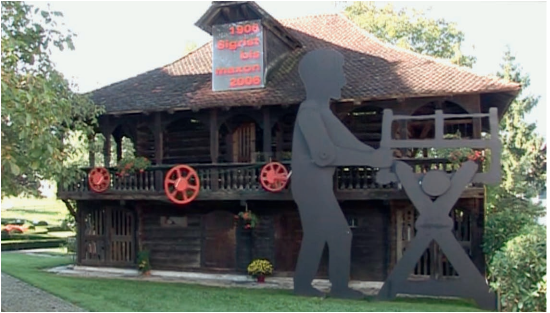
Der Nationale Museumstag 2006, just zum 100. Geburtstag von «Sagä-Chrishti», stand unter dem Patronat der Firma Maxon. Hightech und Handwerk waren angesagt. Mittels Untersetzung bewegte der kleine Maxonmotor den als Schattenriss vergrösserten «Sagimann».

Die traditionelle «Schnätzchammärä» muss der mechanischen Werkstatt weichen. Über Jahrhunderte tradierte und ständig weiter verfeinerte Handwerkstechniken verlieren ihre Bedeutung. Dorfschmieden, Wagnereien, Mühlen, Mostereien und vieles mehr verschwinden aus Weilern und Dörfern.