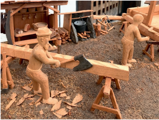
Auf dem Zimmerplatz wird mit der Breitaxt ein Holzbalken zum Spycherbau zugehauen.

Eine geradezu pedantisch-präzise Beobachtung der alltäglichen Dinge und Verrichtungen paart sich in ihnen mit einer naiven Freude an der Darstellung. Was so entstanden ist, verführt vor allem zum Schauen und eigenen Beobachten, nicht zum Spielen. Die Modelle regen zum Denken an, werfen Fragen auf und beantworten sie dem Schauenden, wenn er sich Zeit lässt. Sie sind aus der Stille geboren, und sie brauchen wiederum die Stille, um wirken zu können.