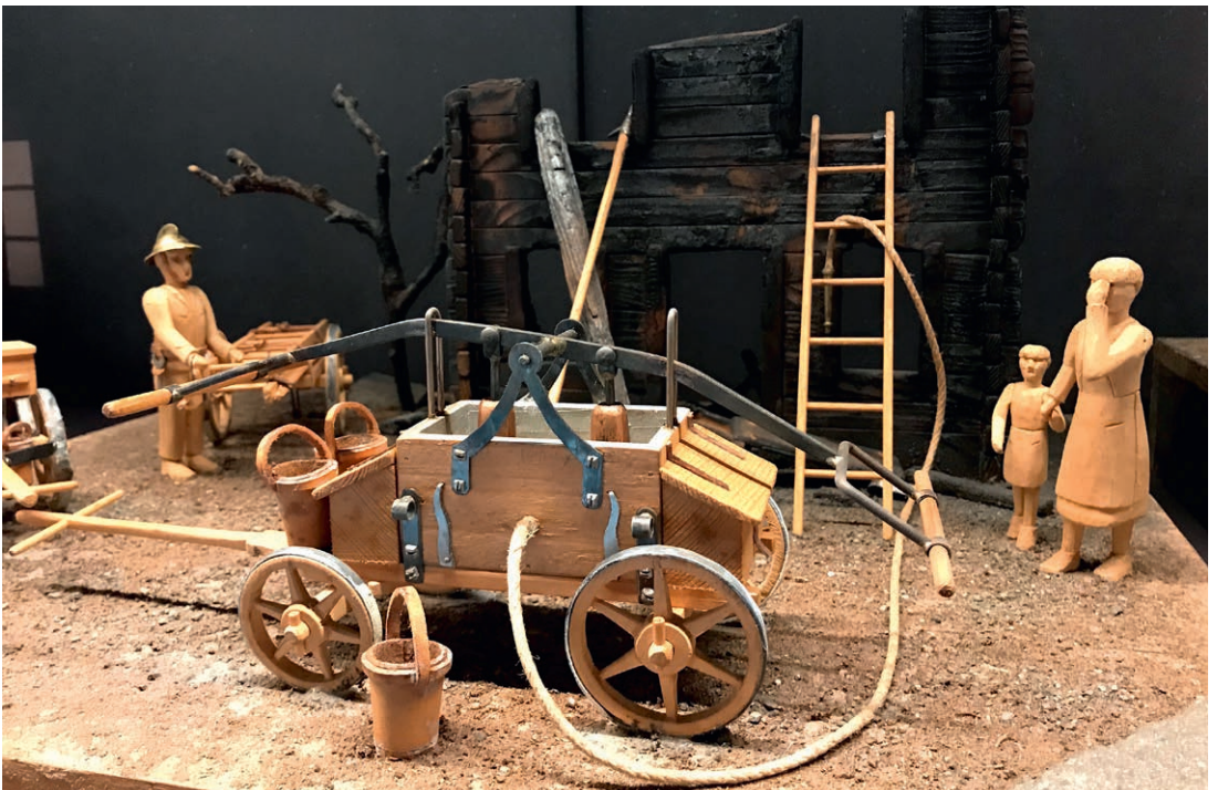
Neben der minutiös konstruierten Feuerwehrspritze kommt mit Mutter und Kind auch die emotionale Tragweite der Feuersbrunst zur Darstellung.