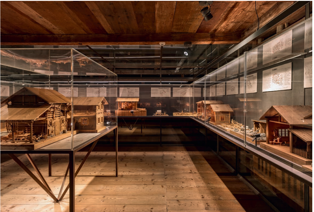
Blick in die Ausstellung mit den 28 Miniaturen zum ländlichen Alltag.